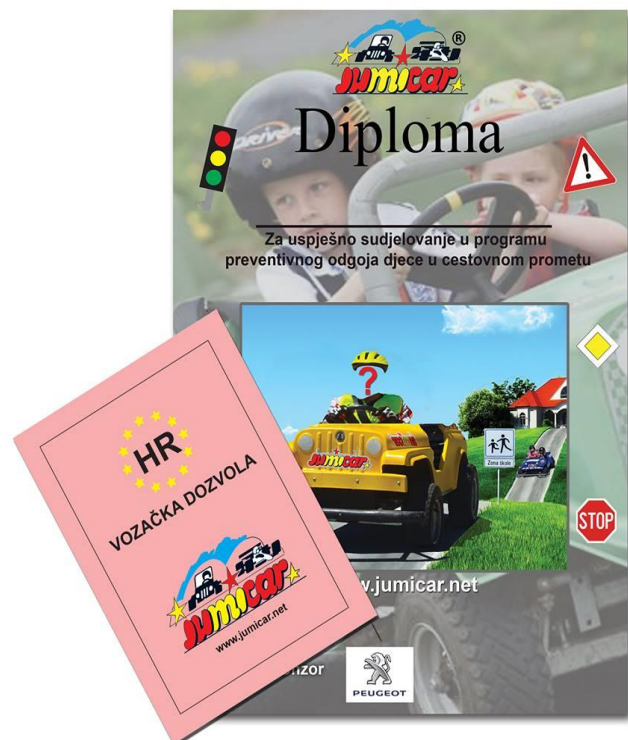
Primjer vozačke dozvole i diplome s fotografijom